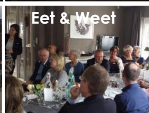
Eet & Weet

Voor meer details zie de volledige jaarrekening