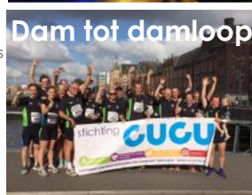
Dam tot damloop