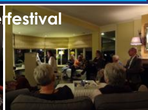
Eet & Weet